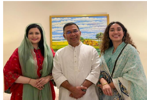
Le Premier Ministre Tarique Rahman lors de sa déclaration des 5 engagements pris en faveur de la sécurité des femmes sur Internet

À l'intérieur du pays, la situation sécuritaire reste préoccupante depuis la chute de Sheikh Hasina : extorsions, criminalité, violences contre les femmes et développement de la « mob justice », c'est-à-dire des lynchages ou violences collectives visant des militants de l'AL, des journalistes, des artistes ou des personnes accusées d'être « anti-islamiques ».