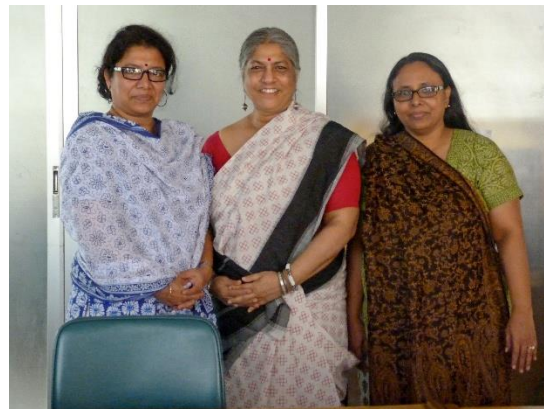
Dans les bureaux de l'association Naripokkho

des groupes de travail de l'organisation sur les thèmes : « Santé et droits sexuels et reproductifs des femmes », « Les femmes oubliées de 1971 » et « WarChildren71 » (les enfants de la guerre de 1971).