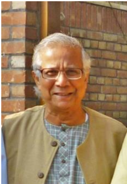
Prof Mohammed Yunus

Le gouvernement intérimaire de Muhammad Yunus a interdit l'AL sans véritable processus de réconciliation nationale ni clarification juridique concernant les responsabilités individuelles. Cela a favorisé des phénomènes de vengeance politique : lynchages de militants de l'AL, destructions de commerces et procès instrumentalisés pour éliminer des adversaires.