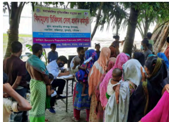
Camp médical dans la région de Gaibandha soutenu par le Secours Populaire Français à la demande de notre comité

Les soins de santé secondaires sont assurés par des professeurs et des consultants expérimentés issus des deux hôpitaux et de l'université médicale de GK. Tout l'équipement moderne transportable est à la disposition des praticiens.