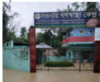
Le Centre de santé de Naodhar bien que les pieds dans l'eau a servi de refuge