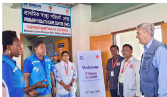
Filippo Grande (HCR) avec des membres de GK et du HCR

Une délégation conduite par le Haut-Commissaire des Nations Unies pour les Réfugiés a visité le Centre de santé de GK installé dans l'abri anticyclonique n° 64 sur l'île de Basanchar où sont actuellement confinés 20 000 réfugiés Rohingyas. Il a eu des commentaires très positifs, notamment sur la nouvelle installation de télémédecine.