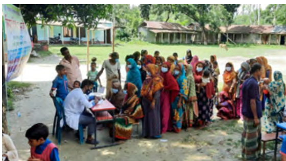
Accueil dans un camp médical de la région de Gaibandha

La fonction principale des camps est de diagnostiquer, traiter et de transmettre des connaissances générales sur l'hygiène, l'eau et l'assainissement, la santé et la nutrition. Construire le réseau social pour entreprendre la préparation avant et après une catastrophe, assurer la réponse aux problèmes de santé dans l'urgence et le rétablissement des personnes dans le même temps font aussi partie intégrante de l'approche des camps lorsque cela s'avère nécessaire.