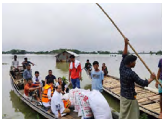
Distribution alimentaire dans la zone submergée

GK comme toujours a été immédiatement sur la brèche et s'est adapté aux conditions particulières de zones submergées à 90%, centres de santé inclus.