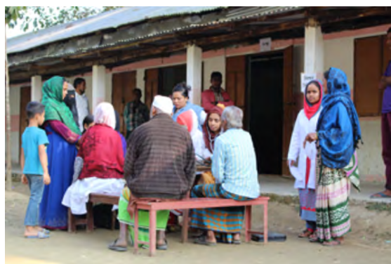
Les patients dans les camps médicaux sont surtout des femmes, des enfants et des vieillards