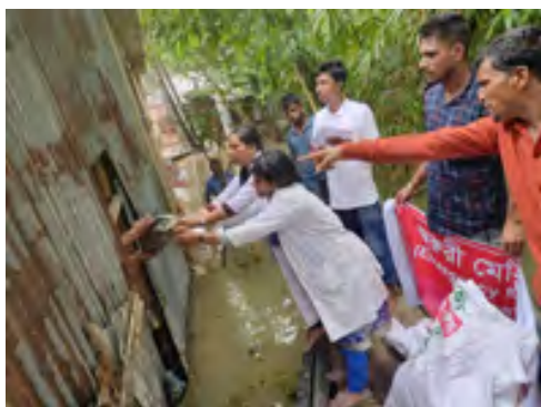
Distribution alimentaire en barque

Ses employés chargés de la distribution de sacs alimentaires, ses paramédics et ses médecins ont sillonné la zone qui leur avait été affectée en barques. Ils ont aussi distribué de la nourriture pour le bétail. Ils ont organisé des camps médicaux d'urgence dans deux écoles pour soigner les nombreux habitants qui nécessitaient des soins urgents pour diarrhée, infections des yeux ou de la peau. Plus de 20 000 familles ont pu être ainsi secourues.