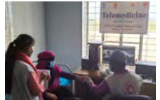
Télé-médecine à Basanchar