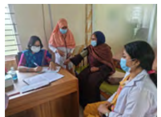
Nouveau camp médical à Shantiganj