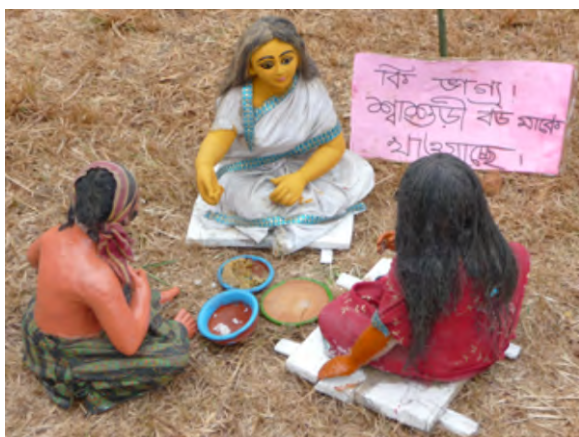
Ce qu'il ne faut pas faire : servir en dernier le peu qui reste à la jeune femme enceinte tandis que le mari et sa mère ont leur assiette pleine