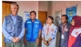
Le représentant du HCR à Basanchar